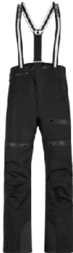
*BLACK PRINT SIZE S (M) , M (L)