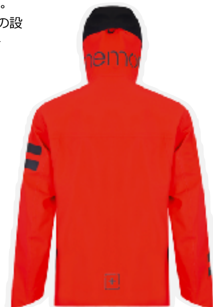
BACIO (レッド) x BLACK SIZE XXS (XS) ~ M (L)