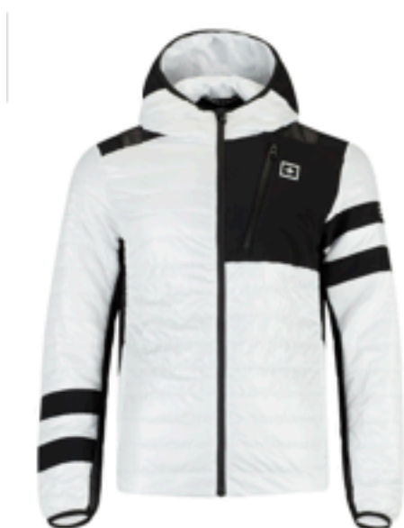
WHITE x BLACK SIZE M, L