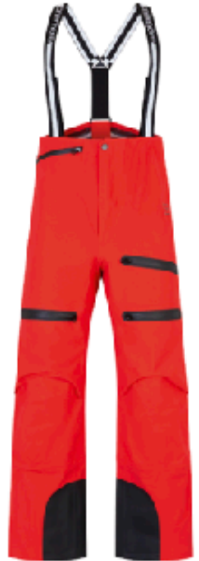
BACIO (レッド) x BLACK SIZE XS (S) , S (M)