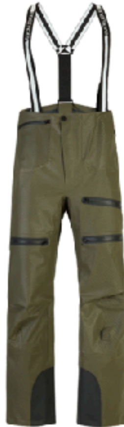
*SURVIVOR PRINT (カーキ) SIZE S (M) , M (L)