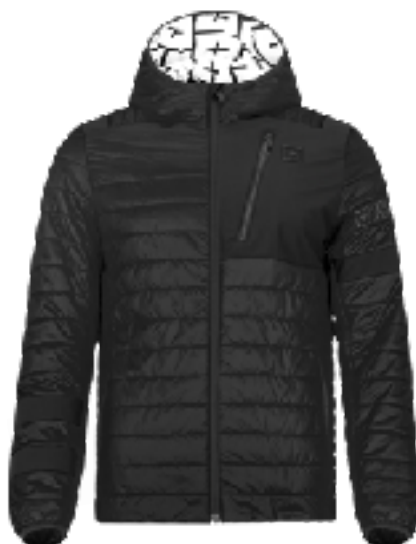
BLACK x BLACK SIZE XXS ~ L